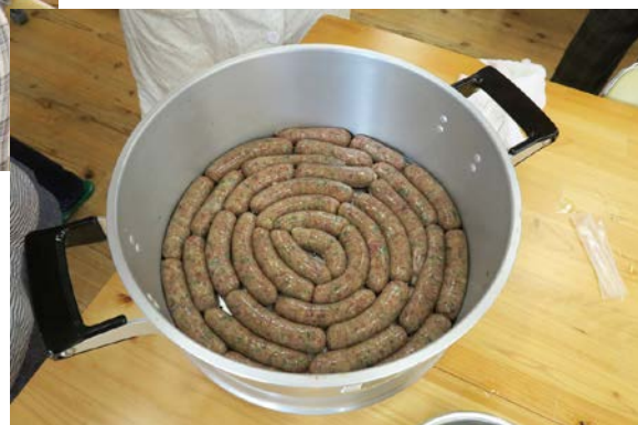
シカ肉ソーセージづくり