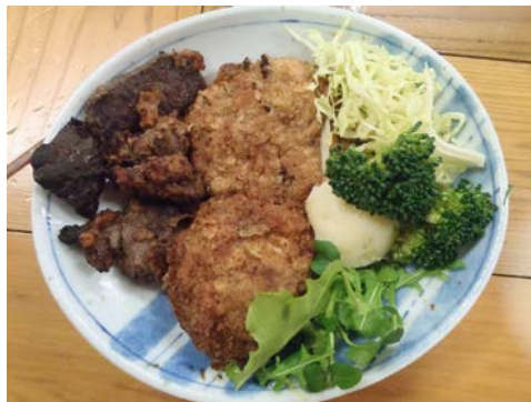
シカのメンチカツ、燻製、竜田揚げ。お野菜や天然酵母パンなどでお腹いっぱいでした