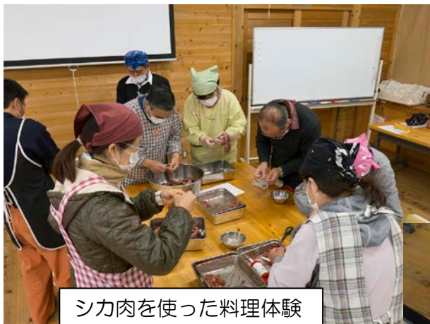
シカ肉を使った料理体験