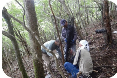
2、3人で1組になります。薄暗い森林内で作業したので、「ネットが見えん〜」という悲鳴も。