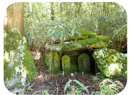
木頭、木沢方面への歩き道を見守ってこられた信義峠にある2体の地藏菩薩。