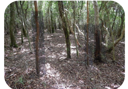
作業終了後、森を見ると、ネットが巻かれた木がたくさん。おかげで保護できます。