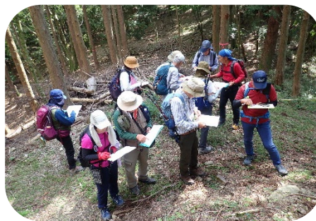
風も心地よい尾根道。丁寧に方角を確認しながら、特に下りは間違いに注意します。