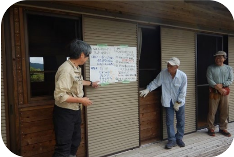
講師から、ネットの張り方指導がありました。最近ではモミジ類の被害もあるとのこと。

日垂ふるさと振興財団の助成を受けて、毎年行っている活動です。高丸山のブナ自然林で、シカによる足元植物や、樹皮を食べられる被害が起きています。それを防ぐために、今回は樹木ガードネットを木に巻きつけました。講師からより効果のあるネットの張り方の指導があり、それに倣って作業を行いました。1日で80メートルのネットを使用しました。