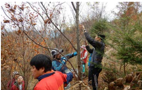
種とりは楽しいので夢中になります

2回目は12月17日（土）に実施します。千年の森の苗木を育てるときに使った、マルチキャビティコンテナに播種をやってみます。遊学の森の苗木のように、うまく育つかなあ。