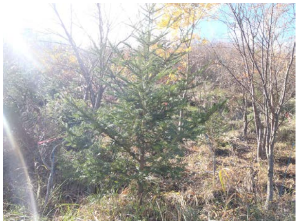
順調に大きくなっているモミの木。いい樹形なので、クリスマスツリーにされないか心配(笑)