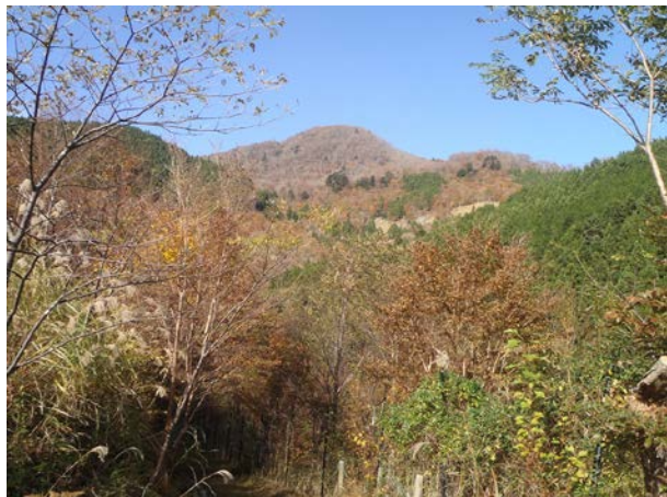
11月中旬の高丸山です。山頂は紅葉が終わり、森づくり区画は紅葉真っ盛りの時期でした。