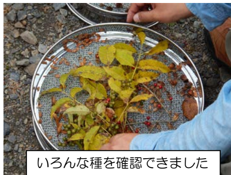
いろんな種を確認できました