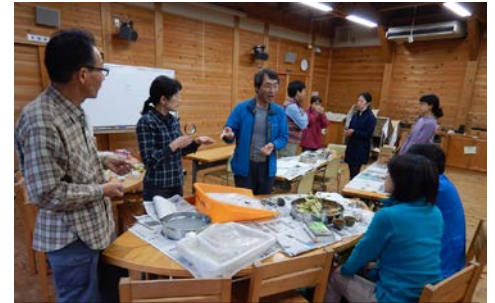
採った種はなんだろう。調べました