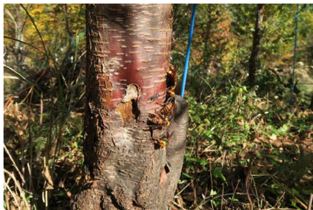
スズメバチたちも大急ぎで樹液をなめています。冬越しの栄養はとれたかなあ。