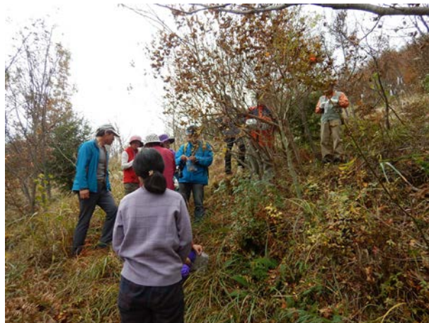
11月中旬には、ふれあい館のイベントで、遊学の森の木の種とりをしました。