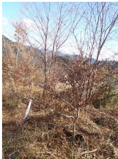
交流の森の木々も大きく育ちました。補植したブナも、今年も目いっぱい枝を伸ばしたようです。