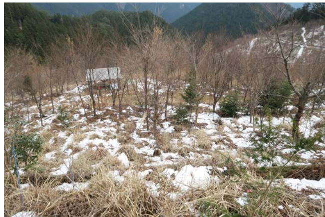
この時期ならではの景色。葉が茂るときには、この角度からはあずま屋が見えなくなっています。