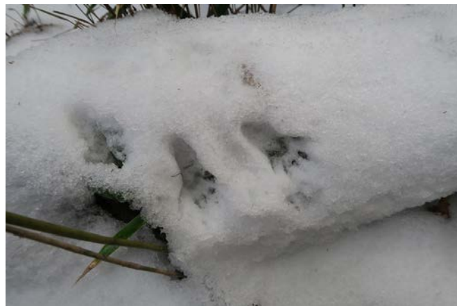
これは小さなものだったそうです。調べてみると、リスの足跡とのこと。リスもいるんですね。