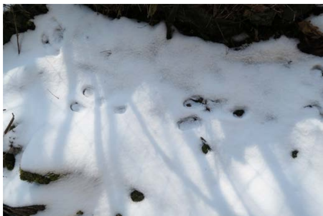
こんな時期ですから、人よりも動物たちがよく訪れているようです。ウサギとおぼしき足跡発見。