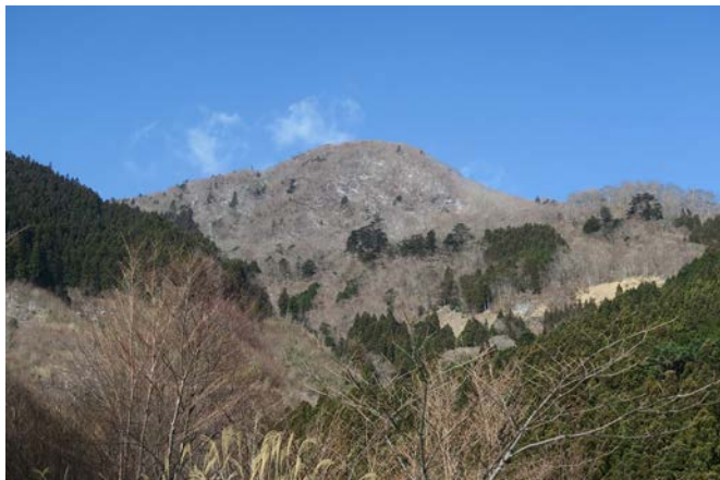
1月中旬の高丸山です。お天気良く、山頂から中腹にかけて雪が見られます。