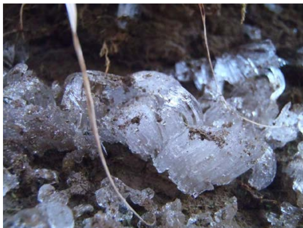
見回り道を歩いていると、日陰のところに立派な霜柱がありました。触ると崩れずカチカチでした