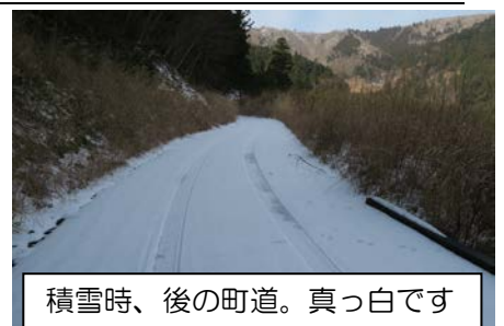
積雪時、後の町道。真っ白です

なお、ふれあい館は水曜日以外は開いていますので、山に上がる前にお立ち寄りください。山の情報をお知らせいたします。