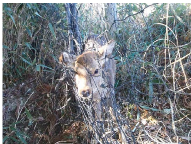
森づくり区画の外周ネットを見回りしていた時に、生きた子ジカがかかっていた。