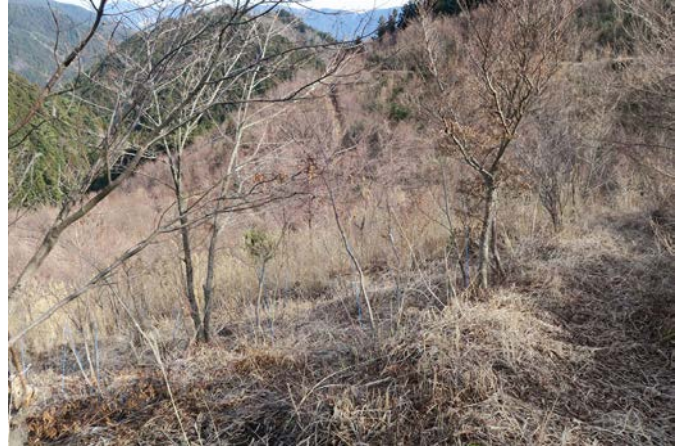
2月ともなれば、遊学の森の木々たちの冬芽も、ほんのり赤く色づき始めています