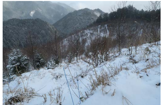
上の写真と、位置はずれていますが、大体同じ角度。雪の日は道がくっきり見えます