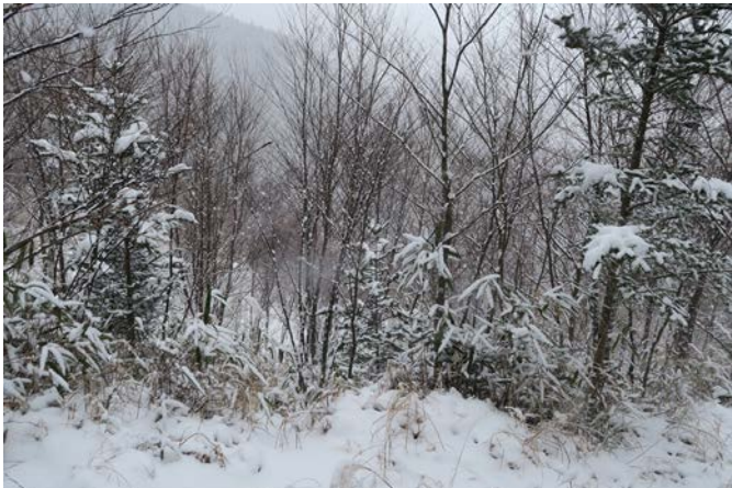
2月10日は雪が降り積もりました。森の中も真っ白で、いつもの景色と違います