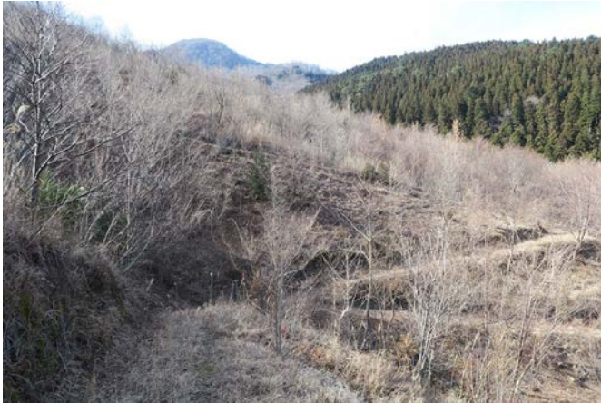
2月下旬の高丸山です。今月は雪が降ったり、暖かかったりと、温度の変化が激しい月でした