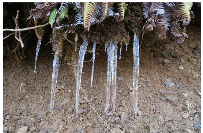
小さいですが、つららもありました。さすが山の中。本格的な春が待ち遠しいです