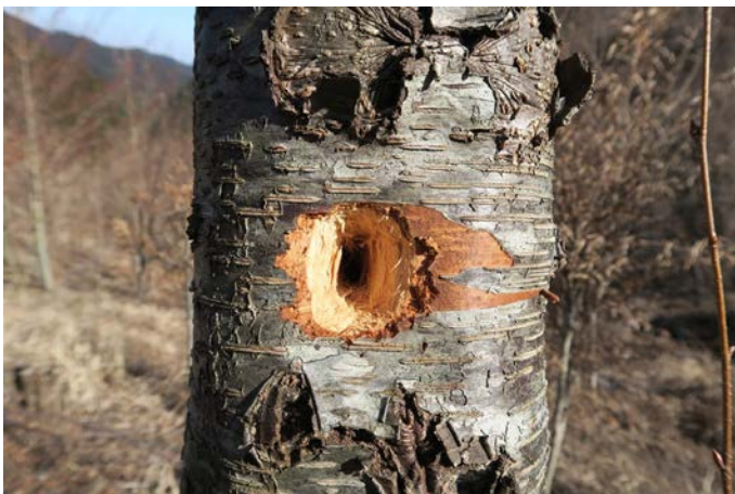
ミズメの木にキツツキの仲間が穴をあけてくれたようです。中にある虫をとってくれたかな