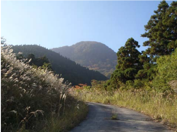
10月中旬の高丸山。少しずつ紅葉が始まっています。日ごとに秋が深まっています。