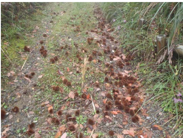
遊学の森の作業道の一地点に、クリのイガが集まっていました。誰の仕業かなあ。