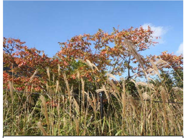
駐車場付近のヌルデが、中旬以降、緑から紅葉への移り変わりを見せてくれました。