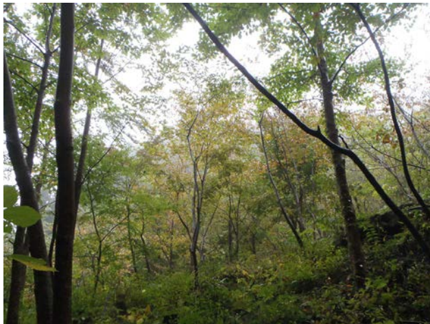
遊学の森の木々も、少しずつ色づき始めています。紅葉も楽しめる森になってきました。