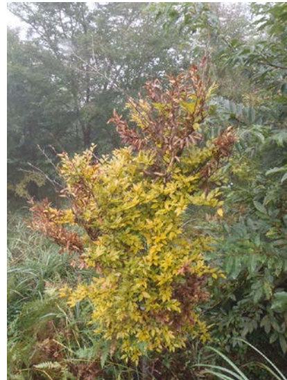
ブナは他の木よりもいち早く、黄葉していました。カミキリムシに枝がかじられたため、一部の葉が茶色になっていました。