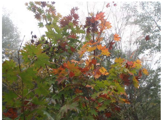
コハウチワカエデです。赤、黄、緑と色々な色の葉っぱが見られました。色彩がにぎやかです