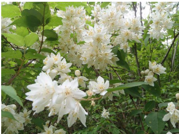
今年はウツギの花がたくさん咲いて、見物でした。とてもきれいで、雪のようでした。