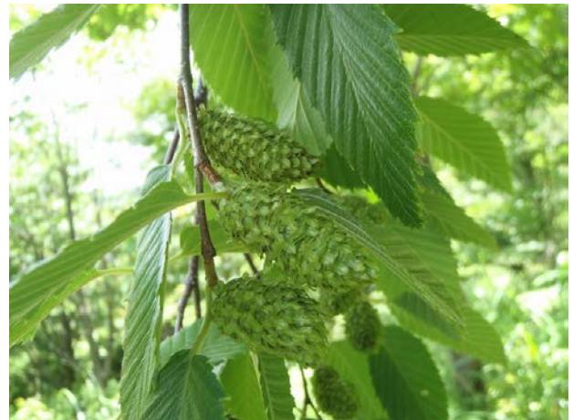
よく見ると、種のもとが鈴なりになっていました。これだけあると確かに重たいなあ。