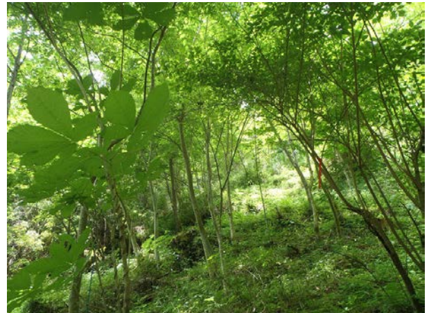
森の中の様子です。下草もこれから大きくなります。新緑がとてもきれいです。