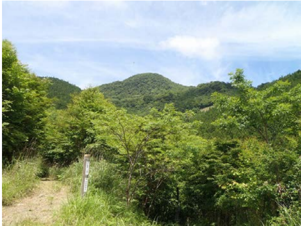
6月の高丸山です。梅雨の合間の晴天時は、駐車場までハルゼミの鳴き声が聞こえます。