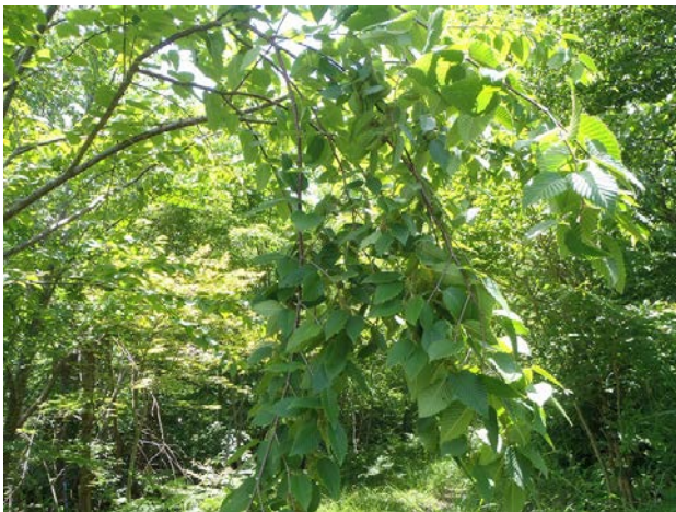
森の中で重たそうに枝を下げている木がありました。ミズメのようです。どうしたのかな。