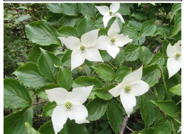
ヤマボウシも花をたくさんつけていました。初夏は白い花がたくさん見られます。