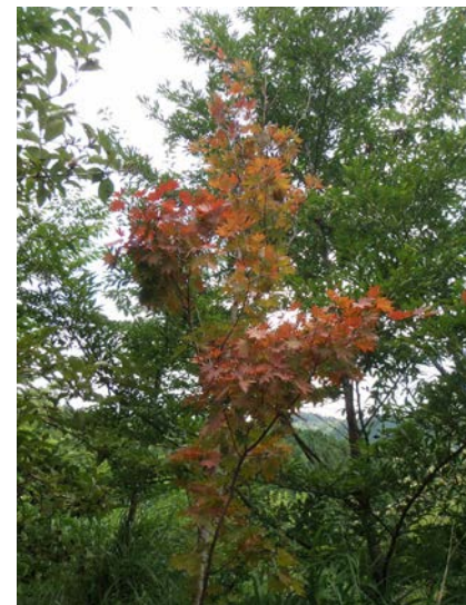
こちらは一足早い秋を感じさせる写真です。コハウチワカエデが赤く色づいていました。周囲が緑なので、よく目立ちます。