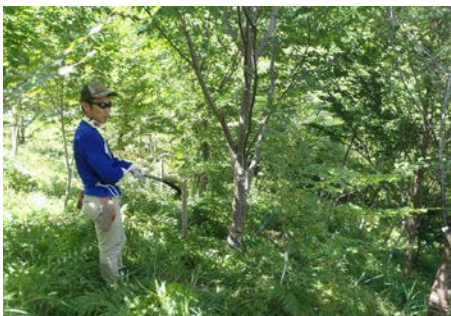
一息入れつつ森づくり。汗だくです

ふれあい館に戻ってからは、使った道具の手入れということで、刃物研ぎを体験してもらいました。一日みっちり山での活動でした。お疲れ様でした。