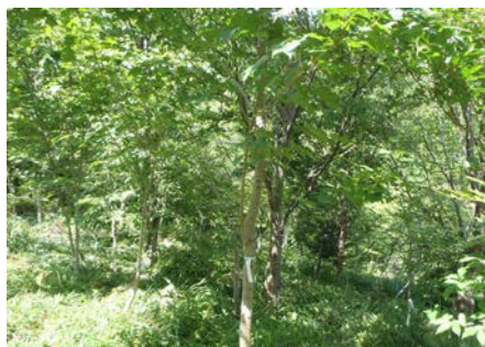
草を刈ったあと。さっぱりしました