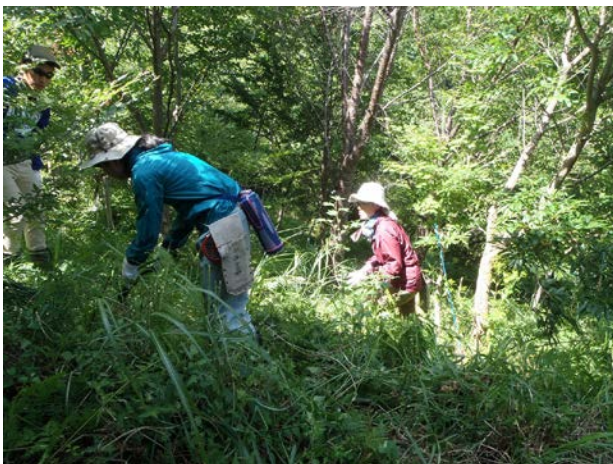
毎年恒例の初任者研修を受け入れました。毎年暑い中、遊学の森で草刈りをしてもらいます。