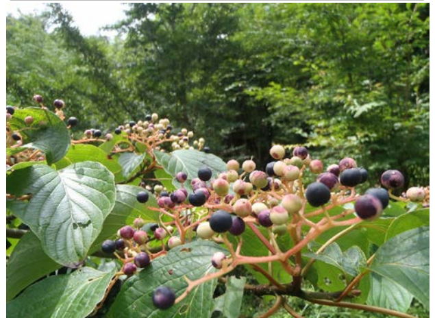
お盆を過ぎてから森づくり区画にあるミズキの実が色づき始めています。カラフルだなあ。