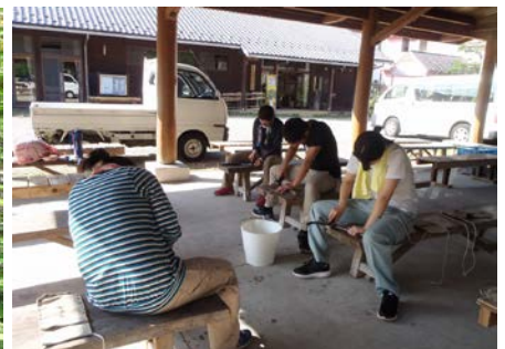
初めての刃物の手入れ。なかなかです