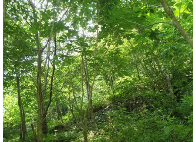
遊学の森の林の中は、緑がまぶしいくらいです。夏にエネルギーを作って使って来年に備えます