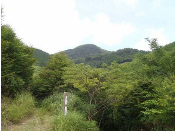
8月の高丸山です。本当に暑い夏でした。下旬は台風が立て続けで、雨も結構降りました。