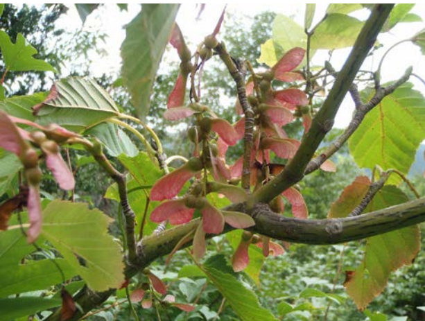
一足早い秋の報告です。赤く色づいた、ウリハダカエデの実です。とても目立ちました。