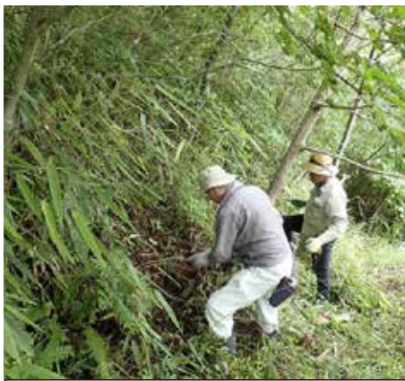
29番区画。スズタケと奮闘。

毎年恒例の合同森づくり大会。梅雨のさなかで天気が心配でしたが、当日は晴天。汗をかきながらの森づくりでした。ボランティアグループは2団体参加。一般のボランティアが5名参加されました。1人のプロよりも、5人の素人。草刈りは人海戦術なので、人数がものを言います。ときおり休憩やおしゃべりを交えながら、草刈りや除伐に精をだされていました。今年度はあと2回、開催予定です。引き続きがんばっていききたいと思います。