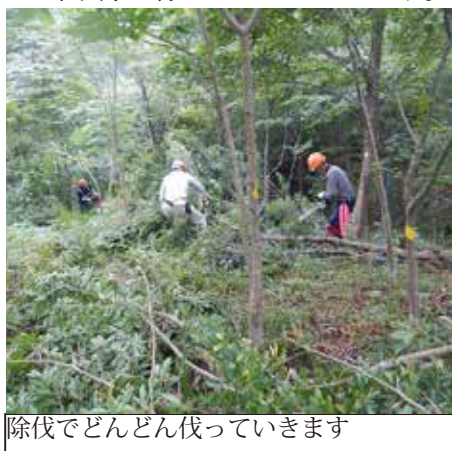
除伐でどんどん伐っていきます

除伐は植樹木以外のシロモジ、カナクギノキ、ウツギ、エゴノキなどです。植樹した木よりも一足先に大きくなっているため、より混雑した森の様子になってしまいます。伐ると森が一気に明るくなりました。モニタリングは事務局が支援に入りました。数えると、植樹した木の種類のほとんどが残っていました。少ない本数のものもあるので、大事に育てていきたいものです。