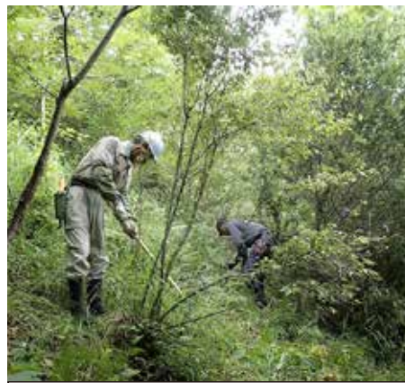
15番区画。あっという間に草刈り終了