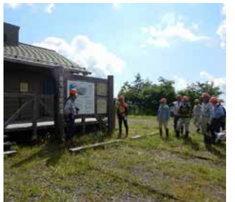
活動前に千年の森事業の話を聞きます