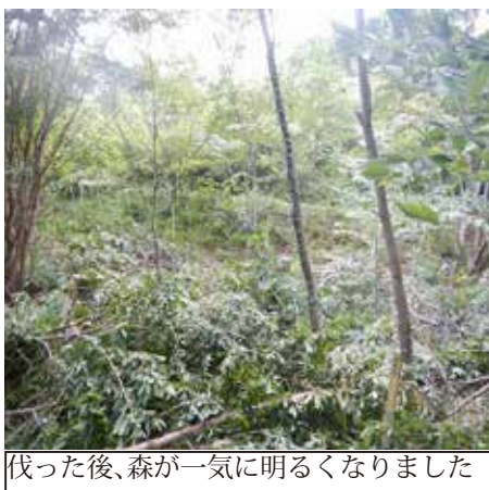
伐った後、森が一気に明るくなりました