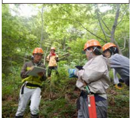
モニタリングもみなさん熱心でした

千年の森ふれあい館(指定管理者:一般社団法人かみかつ里山倶楽部) 〒771-4502 上勝町旭中村 66-1 TEL: 0885-44-6680 FAX: 0885-44-6681 E-mail: sennennomori@@kkcatv.jp ※本便りは、千年の森 HP にフルカラーでアップ中です。