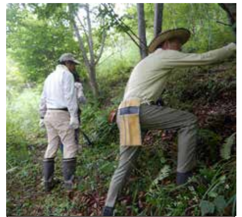
一般ボランティア。草刈りが大変でした