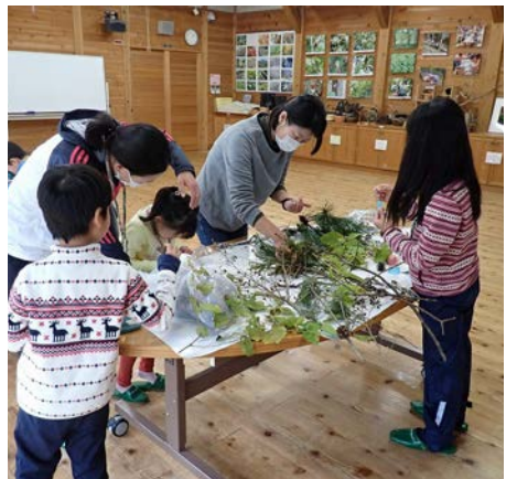
ふれあい館でタネの観察をします