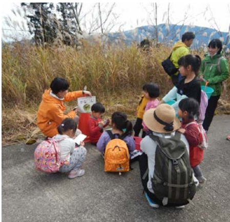
帰り道はゲームをしつつ戻りました