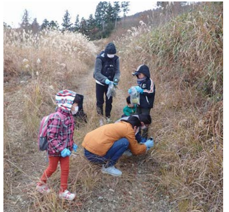
広葉樹のタネはどれだろうか、探します