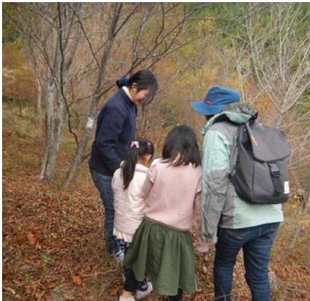
森で見つけたものを親子でシェア中