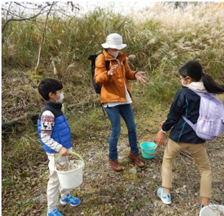
親子でクラフトに使える材料探しです

3つの行事を行いました。3日に「遊学の森の小枝でクラフトづくり」(左上写真)。14日に「続・初めての森遊び」(中心上下写真)。27日に「広葉樹を増やそう①」(右上写真)でした。秋真っ盛りから初冬の森づくり区画で、森に親しみ、学んでもらう活動内容でした。今後もこのような活動をやっていきます。