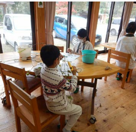
ふれあい館でクラフトワークをしました