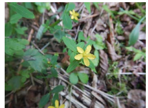
オトギリソウです。よくよく見ると、花にも黒い腺点がついていました