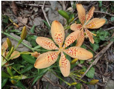
ヒオウギです。花の色や大きさが、森の中で目を引きます。