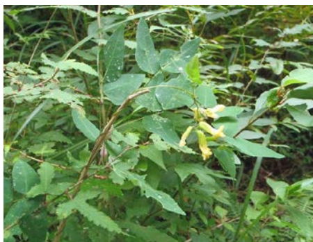
ノサゲです。タネはささげのように黒い色をしています