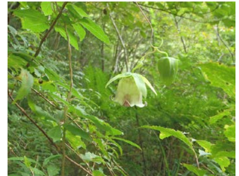
ツルニンジン。花が下向きなのが残念。花びらがカールしてかわいいです