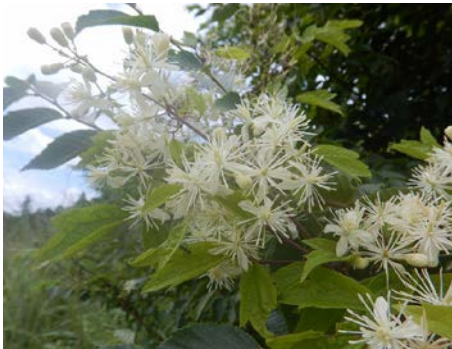
ボタンツルが花盛りでした。真っ白い花が目立ちます

8月下旬でも秋の気配がちらちら見え始めました。駐車場にはススキの穂も出始めており、山では秋がそこまでやってきています。これからは秋の花や虫、野鳥たちがにぎやかになってきそうです。森を歩く楽しみがまた増えてきます。