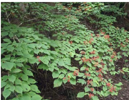
ガマズミの実を見つけました。この状態はまだ酸っぱいのです