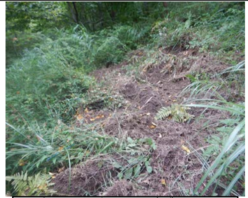
草の合間から、掘り返し跡が見えます