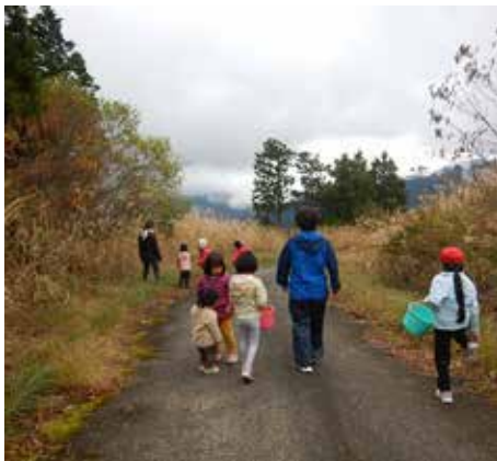
駐車場周りを歩いて、いろいろ探します

秋の深まる11月上旬。森づくり区画で2つのイベントを行いました。1つが「秋の森へ行こう」(主催:あえるば上勝)(写真上列)。もう1つが「遊学の森の小枝でクラフトづくり」(千年の森年間行事)(写真下列)です。「秋の森～」は、上勝町の親子対象にした活動です。森で拾った種やコケ、葉っぱや花などを顕微鏡で観察しました。いろんなものを拡大すると、新しい発見がたくさんです。子どもたちは観察したものをイラストに描いて、お土産にしていました。「クラフトづくり」は遊学の森まで散策し、木の実や木々の落とし物を観察したり枝を拾ったりしました。午後から拾ったものを使って、ふれあい館でクラフトづくりをしました。どのイベントも、秋の森に親しみ、楽しんだ内容でした。