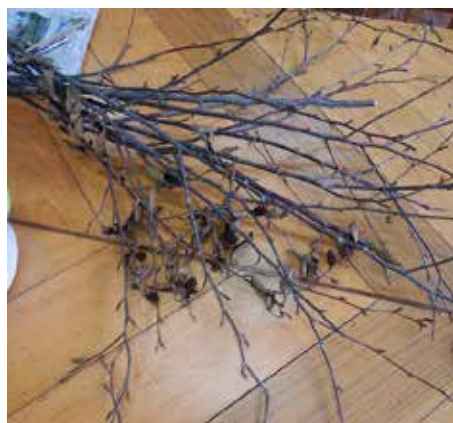
拾った枝や、実を使ってクラフトづくり