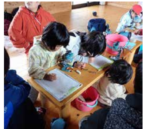
見て印象に残ったものをイラストに