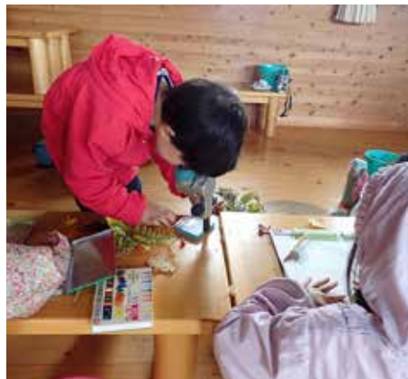
拾ったものを顕微鏡で見るとびっくり