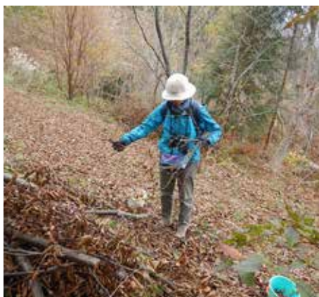
遊学の森で小枝を拾いました