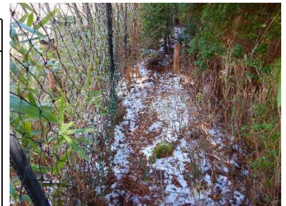
↑3月12日の見回り道。雪が残っていました