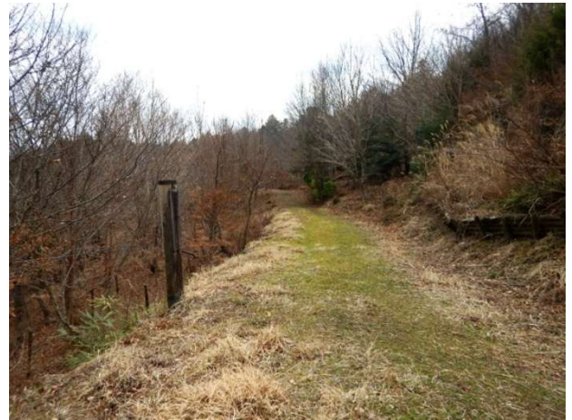
上旬の遊学の森のようすです。まだまだ風も冷たく、新芽もかたく、葉っぱの展開はまだまだ先