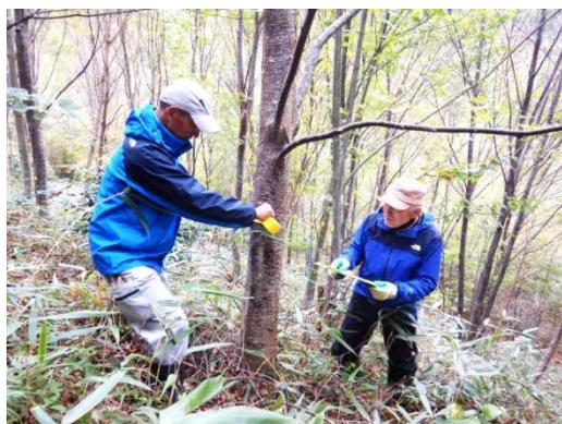
区画にどれだけ植樹木が残っているか、数えていきます(遊学の森モニタリング)