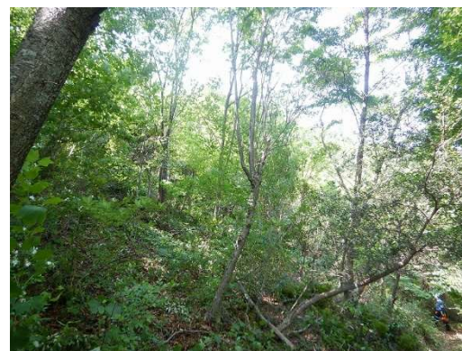
木を伐ると、森の中に光と風が入って、明るくなります。間伐は大事です

徳島県立高丸山 千年の森ふれあい館(指定管理者:一般社団法人かみかつ里山倶楽部) 〒771-4502 上勝町旭中村 66-1 TEL 0885-44-6680