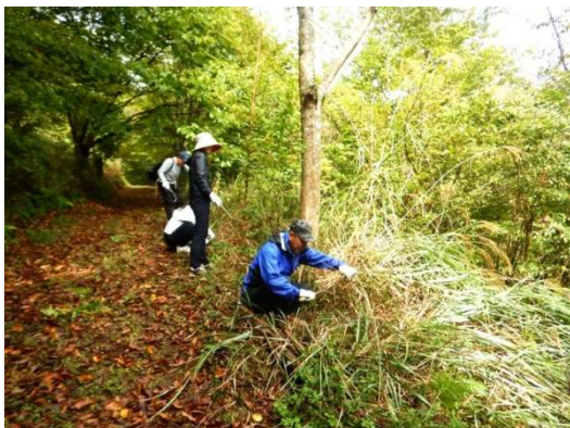
区画によってはカヤが繁茂しているところもあります。草刈りをすると、すっきりします

遊学の森の森づくりを開始して、20年以上が経過しました。現在は植樹した木々も大きく成長し、草刈りはかなり軽減化されています。しかし森の中は木々が混みあっている状況。木を伐って、林内を明るく、風通しをよくする作業が必要です。また、木を伐るためのデータとして、植樹木の残数を調べるモニタリングも行います。