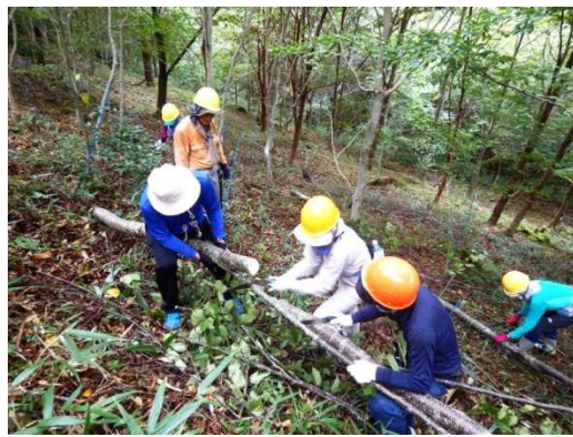
間伐時は、ケガをしないように、注意しながら木を伐ります。大変ですが、ノコギリで行います